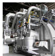
PulsReg ® Regenerativ-Brennersystem