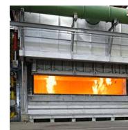
PulsReg ® -Medusa Pulsierendes Regenerativ-Brennersystem

Mehr Informationen unter: www.jasper-gmbh.de