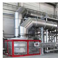
EcoReg ® Drehbett-Regenerator