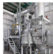
PulsReg ® -Zentral Pulsierendes Regenerativ-Brennersystem